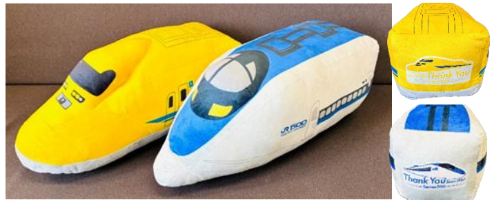
(左) ありがとうドクターイエロー クッション (右) ありがとう500系新幹線 クッション