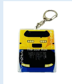
キーホルダー 550円(税込)