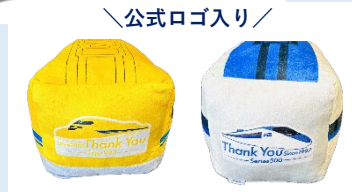
ありがとうドクターイエロー・500系 クッション 各3,960円(税込)