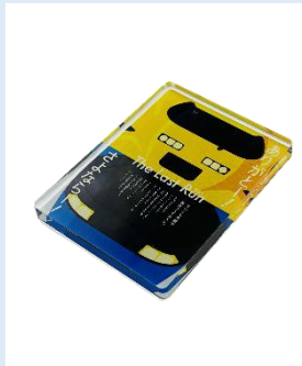
マグネット 550円(税込)