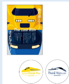
ステッカーセット 660円(税込)