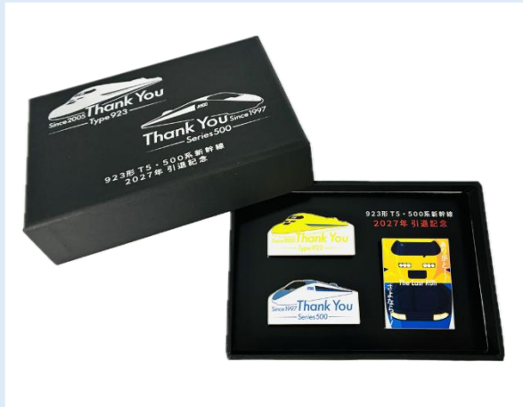
500系・ドクターイエロー引退 公式ビジュアル ピンバッジセット 2,420円(税込)