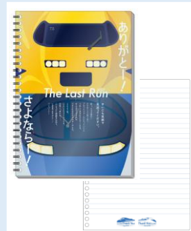
リングノート 550円(税込)