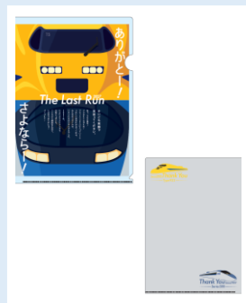
クリアファイル 440円(税込)