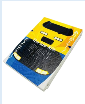
キャンバスパネル 1,760円(税込)