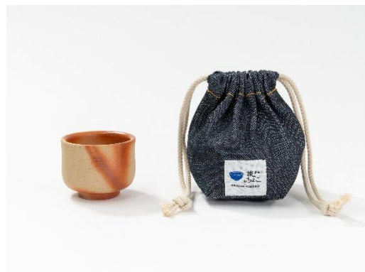
旅するおちよこ 備州窯（岡山県）