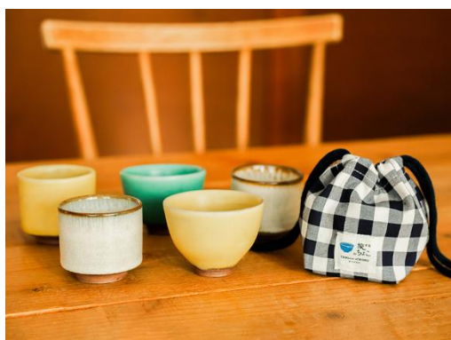
旅するおちよこ 昇陽窯（兵庫県）