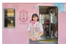
車内アテンダントが 列車の旅をサポート