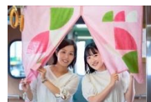
オリジナルの のれんがお出迎え