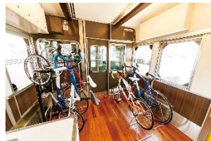
自転車をそのまま積み込める サイクルスペース(要予約)