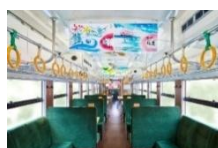
自然を思わせる 落ち着いたインテリア