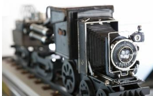
現代アート作家の 作品展示スペース