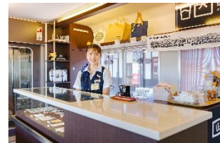
ご当地特産品も取扱いのある 車内販売カウンター