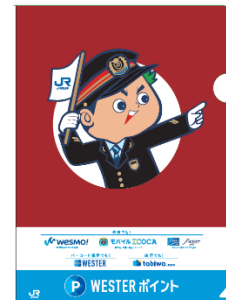
※クリアファイルイメージ