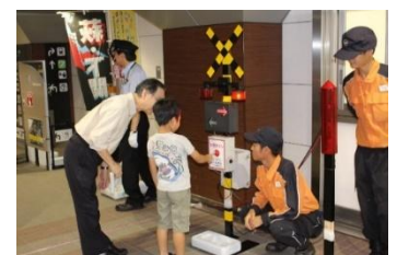
踏切非常ボタン体験 ※イメージ

「こども隙間転落防止プロジェクト」よりスキマモリのリーフレットやシールの配布も行います！