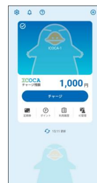
※3 ICOCAアプリホーム画面