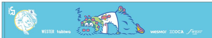
※タオルマフラーイメージ

※小学生以下のお子様は、「こども ICOCA」をご提示いただくと、抽選会に1回参加できます。