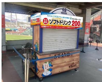
※1 専用ワゴンイメージ

※Appleのウォレットアプリのみの利用者、カードタイプのICOCA、現金、その他の決済方法は対象外です。