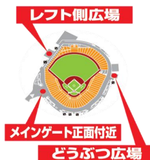
※2 専用ワゴン設置箇所