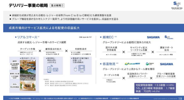
参考:SGH グループ中期経営計画 「SGH Story 2027」