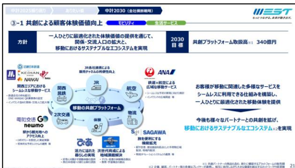
参考:JR 西日本グループ中期経営計画 2030 -次なる成長に向けた共創と挑戦-

※リアルコマース:コンシューマー(個人のお客さま)が立ち寄る場所に提供する配送サービス、2025年7月より「SAGAWA 手ぶらサービス」の名称で運用