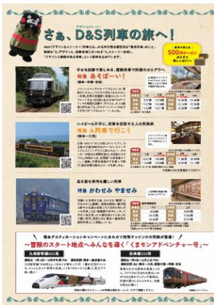
パンフレット中面(イメージ)