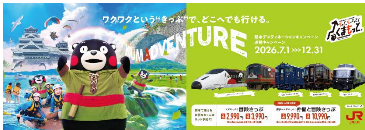
B3ポスターワイド(イメージ)