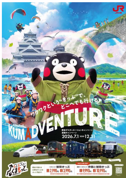
B1ポスター(イメージ)

熊本 DC 連動キャンペーン期間中、主に JR 九州及び JR 西日本の駅、JR 九州在来線列車内等で掲出するとともに駅頭のデジタルサイネージ等で放映してキャンペーンを盛り上げます。