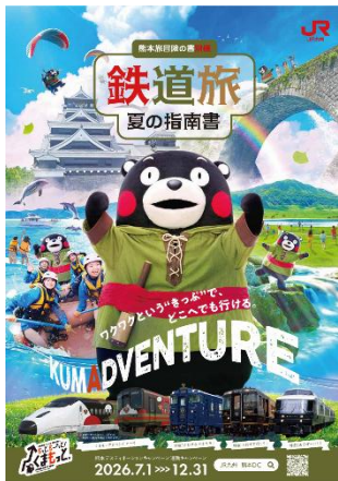
パンフレット表紙(イメージ)

2026年7月～9月までの夏版と2026年10月～12月までの秋版の2版を作成し、熊本の旬の観光スポットや観光素材をお客さまにお届けします。