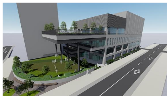
icotto（いこっと）のイメージ