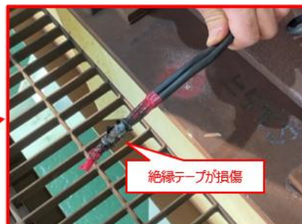
【絶縁テープが損傷】