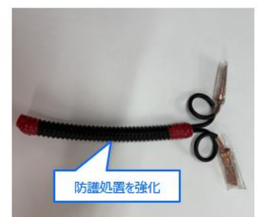
【防護管による絶縁処置】