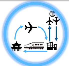
広域観光ルートの構築