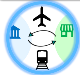
二地域居住の推進

本協定の締結を契機として、さらに多様なパートナーと連携を図りながら、西日本の関係・交流人口の拡大と、移動における持続可能なエコシステムの実現を進めていきます。