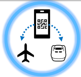
鉄道と航空のシームレスな予約