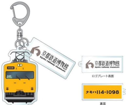
▲アクリルキーホルダー 1,100円(税込)

※輸送上の都合により、展示車両の車両番号と商品デザインの車両番号が異なる場合がございます。