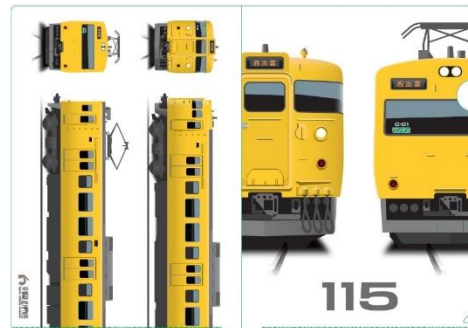
▲A4クリアファイル(イメージ) 550円(税込)

ミュージアムショップ お問い合わせ先：080-3461-5537 (毎営業日：10時～17時)