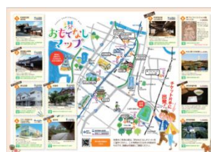
▲堺おもてなしマップ(特典施設掲載)