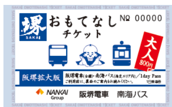
▲堺おもてなしチケット（阪堺拡大版）