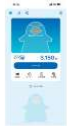
モバイルICOCAの画面イメージ