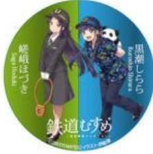
デカ缶バッジ2種 (ツートン) 全2種