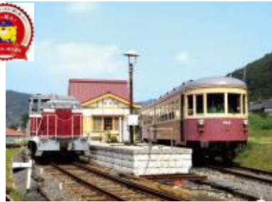
美咲町 『柵原ふれあい鉱山公園』