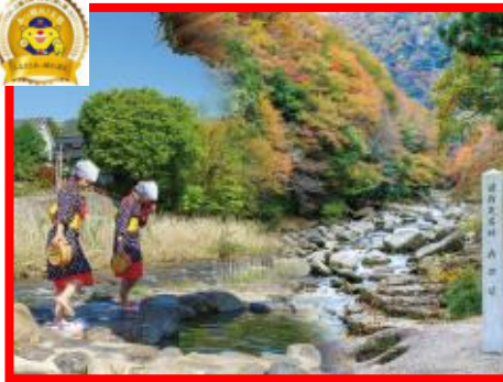
鏡野町 『奥津温泉・奥津溪』