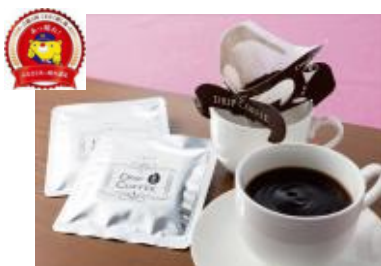
吉備中央町 イージー株式会社 『玄米コーヒー』