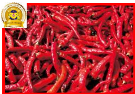
鏡野町 NPO法人 てっちりこ 『奥津 とうがらし』