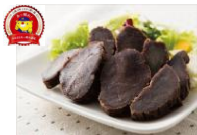
津山市 坂手牧場 『スモークドビーフ』