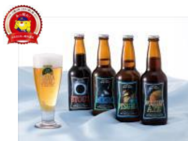
津山市 合資会社 多胡酒造場 『作州津山ビール 宇宙ラベルシリーズ』