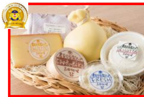
吉備中央町 吉田牧場 『農家自家製チーズ』