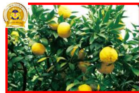
久米南町 久米南ユズ部会 『久米南のゆず』