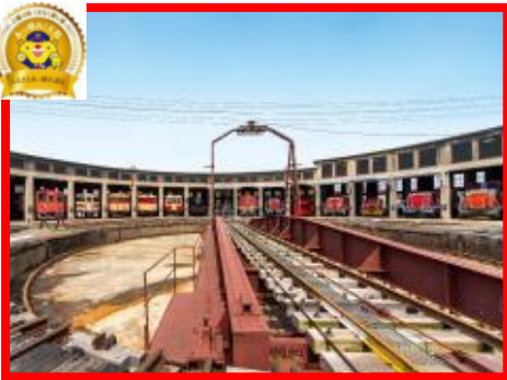
津山市 『津山まなびの鉄道館』