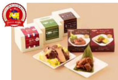
鏡野町 企業組合 鏡野やま弁クラブ ののもの 『ジビエ缶詰“ののもの”』