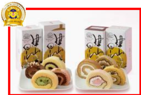
津山市 津山ロール製造菓子店 『津山ロール』