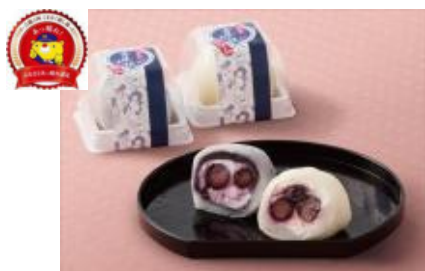
吉備中央町 吉備高原栄屋 『吉備高原 青苺(ブルーベリー)大福』