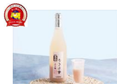
鏡野町 株式会社牧野酒造本店 『五十鈴(いすず) さくら雪』