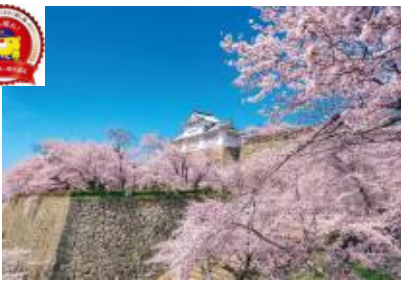
津山市 『津山城(鶴山公園)』