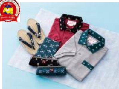
津山市 津山民芸館 『作州緋(かすり)』