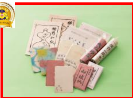
津山市 上田手漉(てすき)和紙工場 『横野和紙』