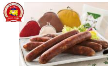
加茂川有害獣利用促進協議会 『猪鹿スモークソーセージ(山のめぐみシリーズ)』