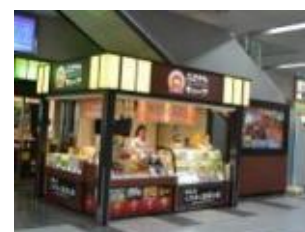
ふるさとキューブ

認定された「ええもん」・「うめえもん」について岡山駅新幹線コンコース内特設店舗「ふるさとキューブ」、「さんすて岡山」および津山駅「セブン-イレブンハート・イン JR 津山駅店」で8月頃より試行販売を行う予定です。