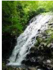
あば温泉 (露天風呂) 布滝