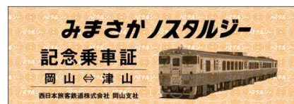
記念乗車証 (イメージ)

上り列車(岡山 津山)は金川～津山間、下り列車(津山 岡山)は弓削～岡山間に配付します。