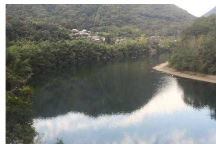
玉柏～牧山間の車窓風景(イメージ)