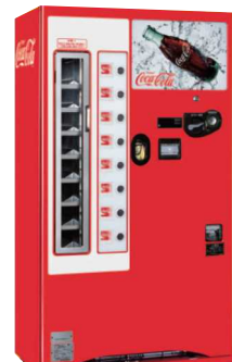
びんジュース自動販売機(イメージ)