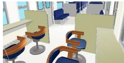
窓向きカウンター席(イメージ)