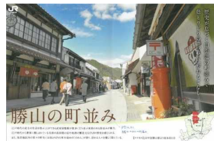
車内広告枠を活用した岡山県北部の魅力紹介 (イメージ)

“懐かしいまちへ向かう”というコンセプトにあわせ、車内の広告枠を利用して、岡山県北部エリアを中心とした観光地の魅力をご紹介します。