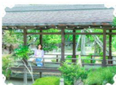
【しっとり過ごす大人の休日】