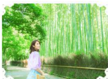
【パワスポで恋愛祈願】