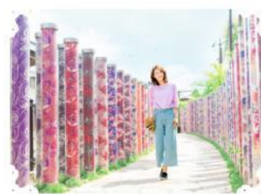
【感性を磨くアート&カルチャー】