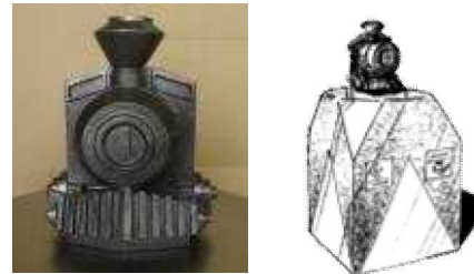
7100形(義経号)蒸気機関車