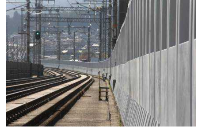
完成写真 (湖西線:志賀~比良駅間)