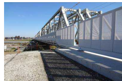
完成写真 (北陸本線:能美根上~加賀笠間駅間)