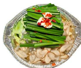
博多もつ鍋やまや～博多もつ鍋～