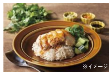
マンゴツリーキッチン～カオマンガイ～

ekieでは定番メニューをはじめ、様々なテイクアウト店舗が“約30店舗”一挙勢ぞろい！「なるとキッチン」からはテイクアウトでも珍しい、北海道 小樽のソウルフード『若鳥半身揚げ』が！さらにekieで人気の「炭焼牛たん東山」や「博多もつ鍋やまや」からは、仙台名物牛たんのお弁当や博多名物もつ鍋がテイクアウトできるようになりました！また、エスニック好きにはたまらないタイ料理、「マンゴツリーキッチン」では、この度テイクアウトメニューの種類が豊富に！ekieで一味違う「おうちご飯」をお持ち帰りください。詳しくは別紙①とekieホームページをご覧ください。(プレス別紙①にて、ekieテイクアウト対応店舗情報を掲載)