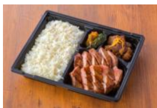
炭焼牛たん東山～特撰牛たん弁当～