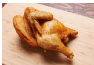
なるとキッチン～若鳥半身揚げ～