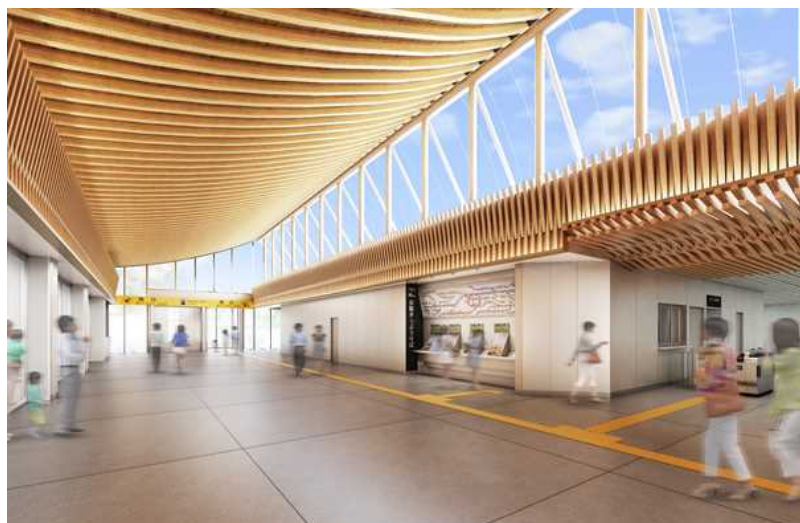
西広島駅外観・内観 「木のぬくもり」を取り入れたデザイン