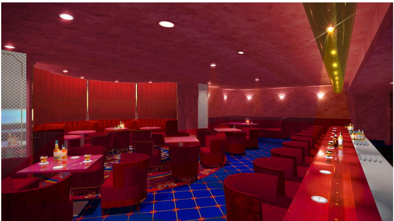
メンバー「メイフラワー」内観イメージパース