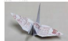
▲おりがみイメージ