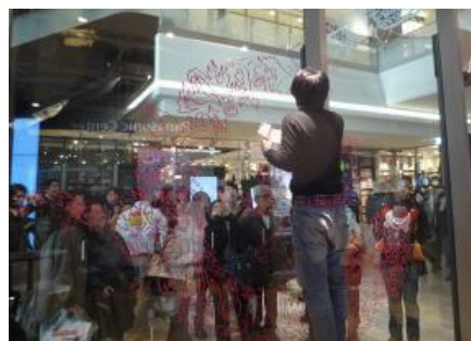
▲ライブドローイングイメージ