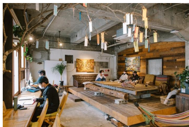
施設内コワーキングスペース、バル