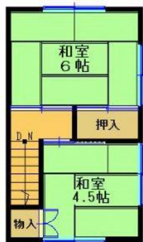
【 2 階間取図】