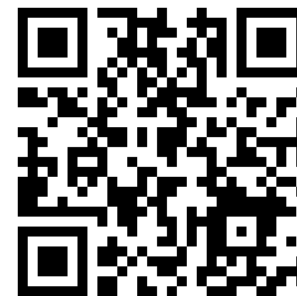
地域共生の取組概要