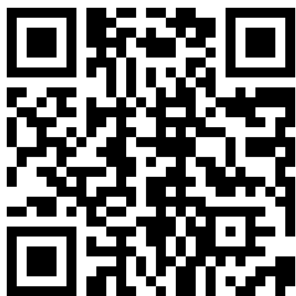
公式ホームページ