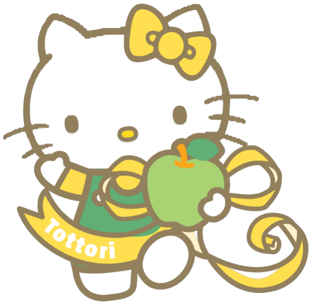
鳥取縣 地區限定 Hello Kitty

首先是舉辦「山陰目的地活動」的鳥取縣和島根縣。兩縣的地區限定 Hello Kitty 也會幫忙宣傳！