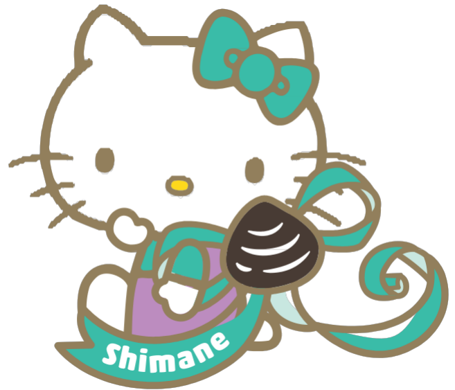
島根縣 地區限定 Hello Kitty