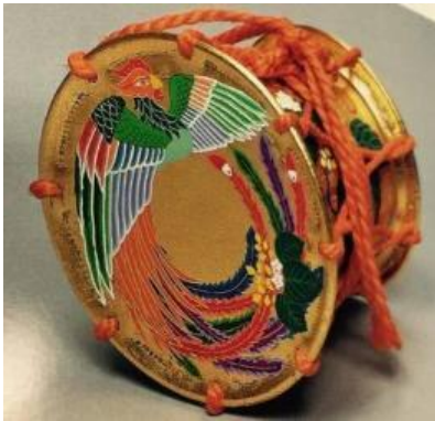
④寶來蝦（京線繩工業合作社：京都市收藏）