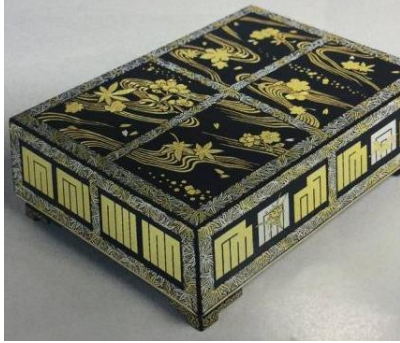
⑥祭禮圖六角搬運容器形裝飾箱 神坂雪佳臨摹畫（京都漆器工藝合作社：京都市收藏）