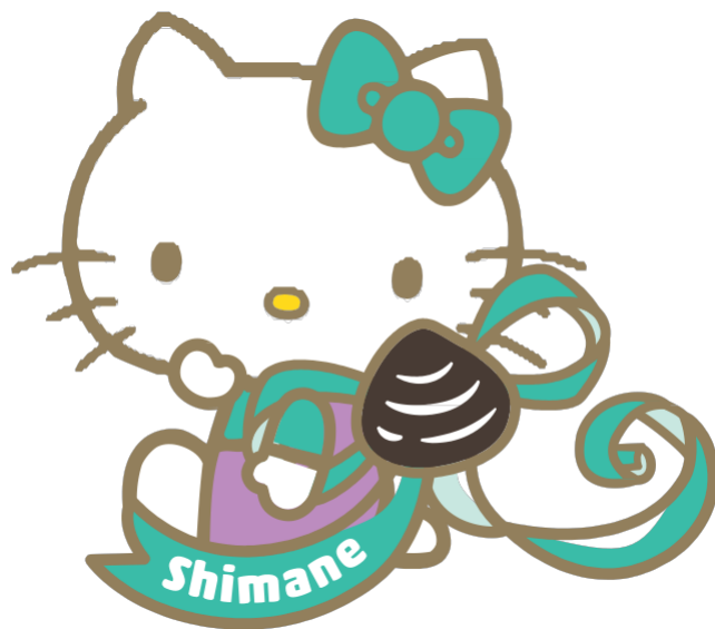
岛根县 地区限定 Hello Kitty

更有其他县地区限定 Hello Kitty，敬请期待！ (大阪府、兵库县、冈山县、广岛县、山口县、福冈县)