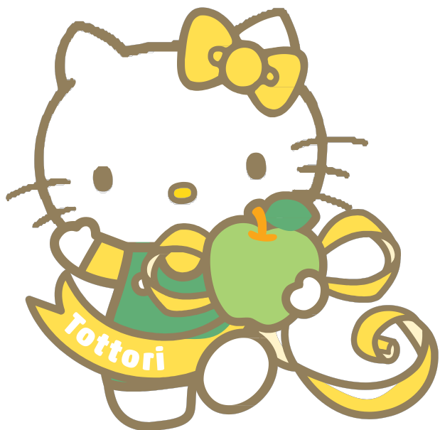
鸟取县 地区限定 Hello Kitty

首先是举办“山阴目的地活动”的鸟取县与岛根县。两县地区限定 Hello Kitty 亦将参与宣传活动！