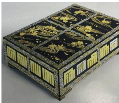
⑥祭礼图六角行器形饰箱 神坂雪佳临摹（京都漆器工艺合作社：京都市收藏）