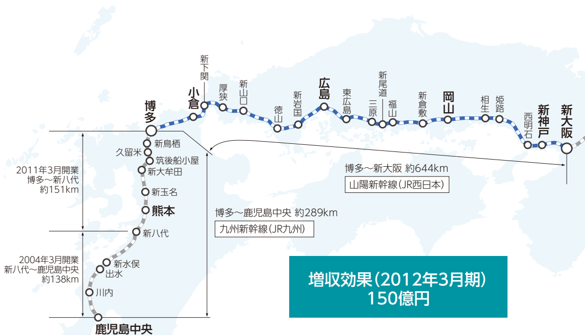
新幹線・航空機との競合 各年3月期 (3月31日に終了した1年間)