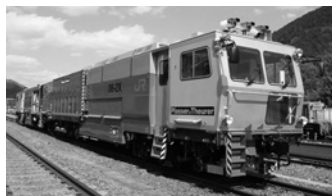
マルチプルタイタンバ(新幹線用)08-2X