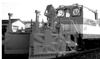
モーターカーロータリーMCR-600