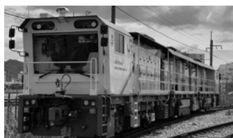
レール削正車(在来線用)LRR16