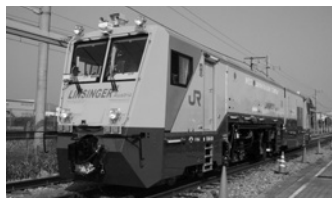
レール削正車(在来線用)SF01T-F