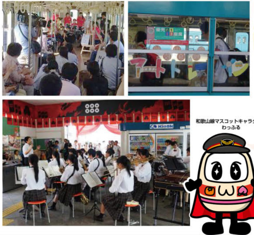
和歌山線マスコットキャラクター わっふる

和歌山線沿線9校の高校・特別支援学校の生徒が主体となり、JR和歌山支社と協力し、和歌山線に臨時列車「アートトレイン」を運行しました。臨時列車内では、各学校の音楽系クラブ等によるリレーコンサートや、駅でのコンサートを同時に開催し、お客様に楽しんでいただきました。今後も地域のみなさまとともに、和歌山線を盛り上げてまいります。