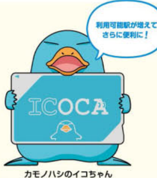
カモノハシのイコちゃん