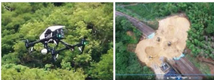
●ドローンによる動画撮影

大規模災害等が発生した場合に、現地の状況を迅速に確認するためにドローンを活用しています。災害状況等の撮影を行いお客様へのタイムリー情報提供に取り組んでまいります。