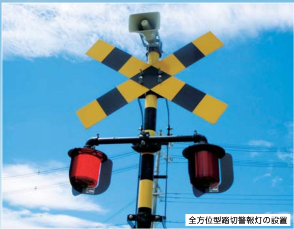
全方位型踏切警報灯の設置