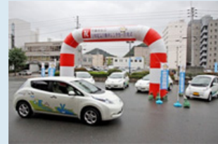
EVレンタカー出発式

平日は各市が公用車として使用している電気自動車を、土日・休日に市民や観光客に貸し出す事業を行政と協働で行い、環境に優しい自動車の有効活用や普及・啓発に努めています。