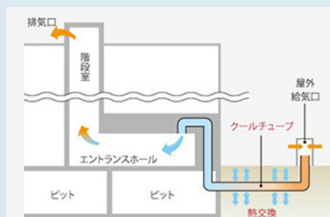
パッシブ換気システム概念図