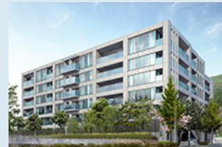
ジェイグラン岡本

「ジェイグラン岡本」では太陽光を集めて室内へ導き、エレベーターホールの補助照明として利用する「太陽光採光システム」や、地下熱を利用してエントランスホールへ適度に調温された空気を送る「パッシブ換気システム」など自然の恵みを取り入れた住まいを目指しています。