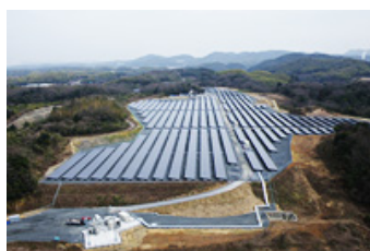
厚狭太陽光発電所