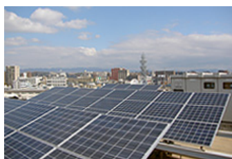
グループ会社でも再生可能エネルギーの活用に取り組んでいます(写真は西日本電気システム株式会社の太陽光発電システムの例)