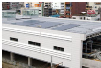
北陸本線福井駅での太陽光発電