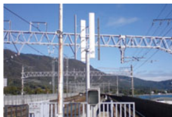
湖西線近江舞子駅での風力発電