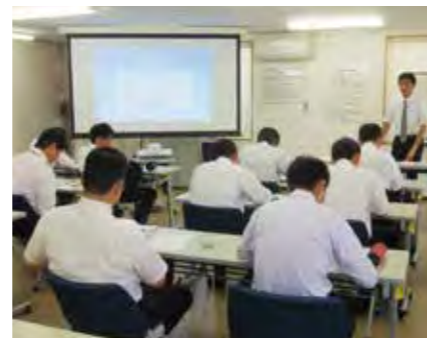
事故現場での研修

⇒鉄道安全考動館における安全研修については、P.28に記載しています。あわせてご覧ください。