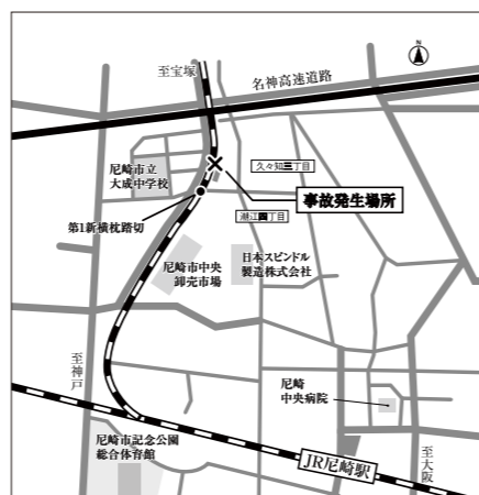
事故発生当時の現場付近見取り図