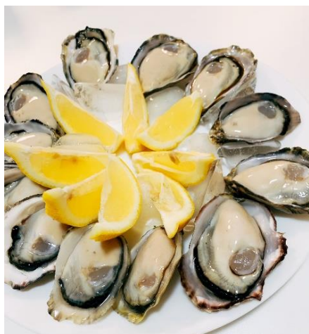
オイスターぼんぼん