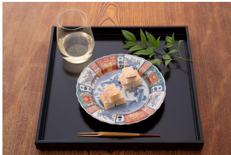
べっ嬢さくらます うららはべん