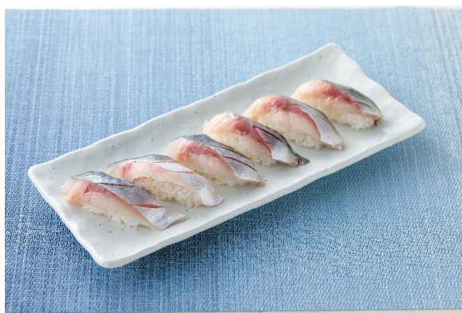
お嬢サバの生握り