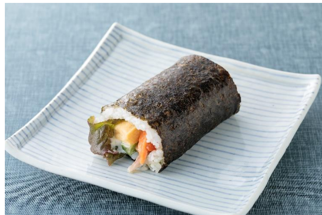
プロフィッシュ恵方巻