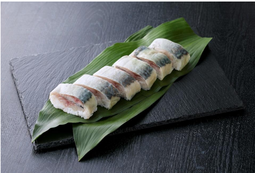
お嬢サバの棒寿司

※商品名や商品内容/価格(税込)は変更となる場合があります。また品切れの際はご容赦ください。