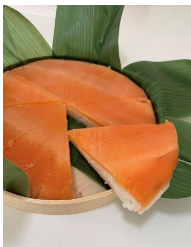
べっ嬢さくらます うらら一重桶