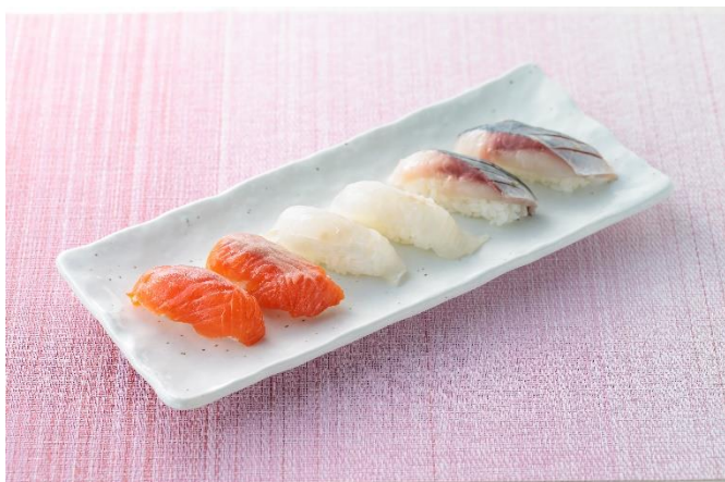
プロフィッシュ三種握り