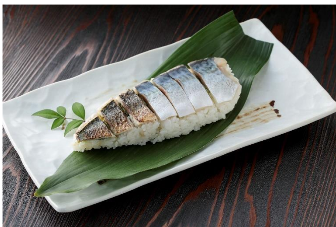
お嬢サバの姿寿司