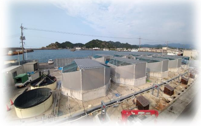
お嬢サバの養殖場