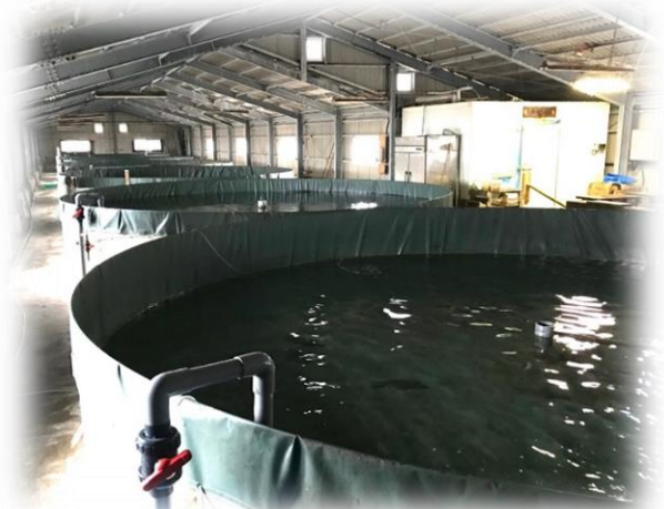
白雪ひらめの養殖場