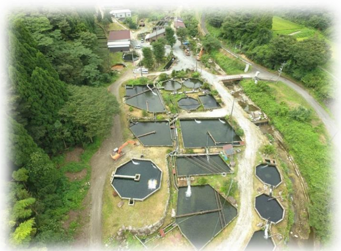
クラウンサーモンの養殖場