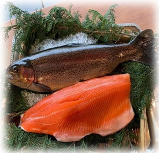
クラウンサーモン