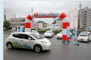
EVレンタカー出発式

平日は各市が公用車として使用している電気自動車を、土日・休日に市民や観光客に貸し出す事業を行政と協働で行い、環境に優しい自動車の有効活用や普及・啓発に努めています。