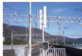
湖西線近江舞子駅での風力発電