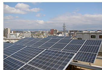
グループ会社でも再生可能エネルギーの活用に取り組んでいます(写真は西日本電気システム株式会社の太陽光発電システムの例)