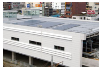
北陸本線福井駅での太陽光発電