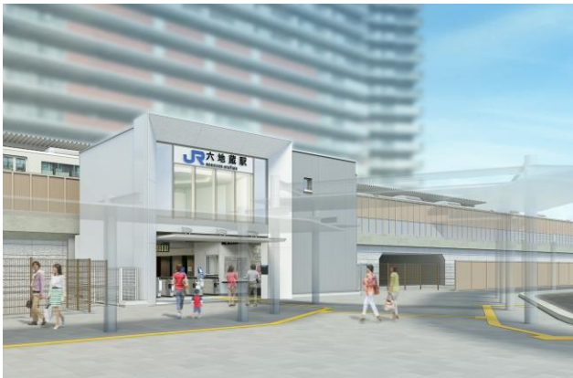
完成イメージ（駅舎外観）

今後の駅周辺の発展を見据え、宇治市の新たな玄関口に相応しい“ゲート”をイメージした外観としました。また六地蔵の地名の由来となった大善寺六角堂（通称：六地蔵尊）から着想を得て、コンコースには六角形の吹き抜け空間をつくります。