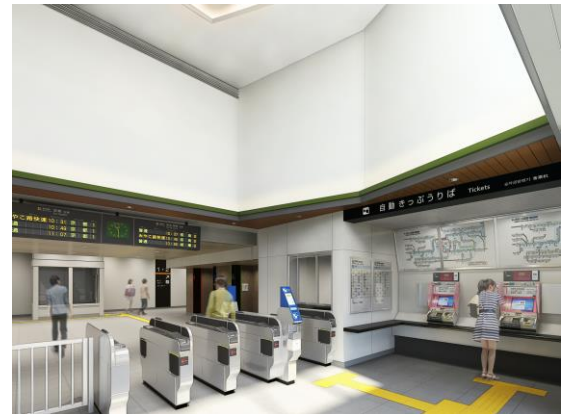
完成イメージ（駅舎内観）