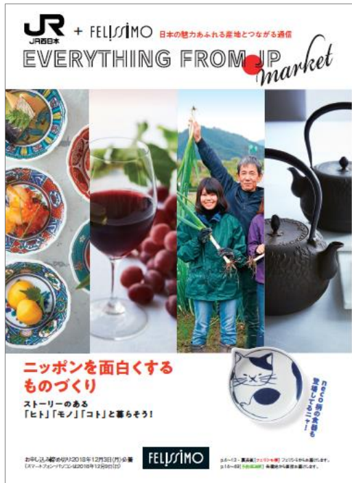
産直カタログの表紙

※産直カタログはフェリシモ会員様及び「EVERYTHING FROM. JP market」会員様への限定配布になります。