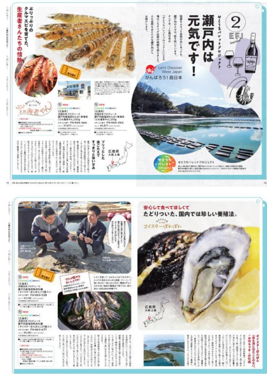
「とれ海老やん」「オイスターぼんぼん」特集ページ