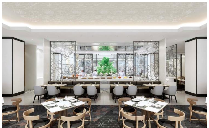
右：レストラン店内パース図 ※CG イメージ