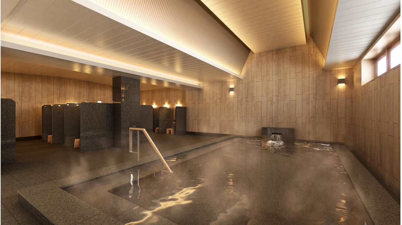
ホテルヴィスキオ京都 大浴場パース図 ※CG イメージ