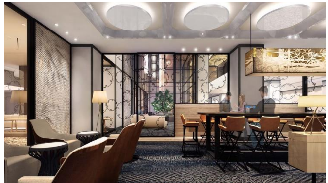
右：宿泊者専用ラウンジパース図 ※CG イメージ

テーブル&ソファを設置し、ゆったりと寛いでいただける宿泊ゲスト専用ラウンジ。滞在中の宿泊ゲストが簡単なミーティングや歓談などに利用できる空間としています。客室内同様に無料でWi-Fiを利用できる快適なインターネット環境を整備しています。