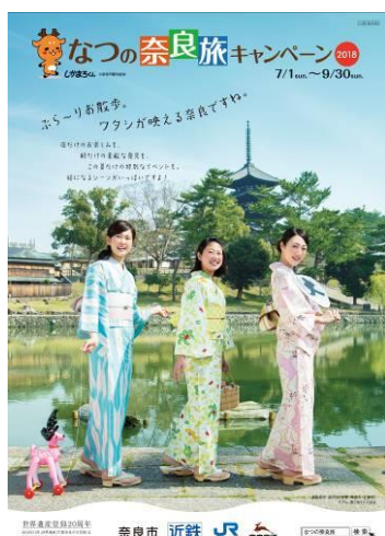
(パンフレット表紙)