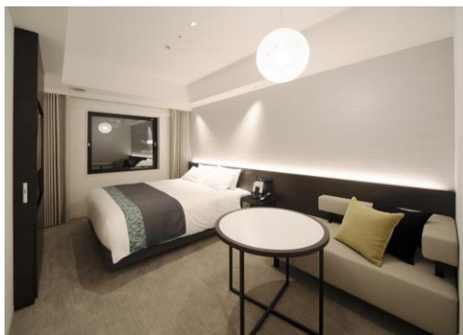
モデレートダブル