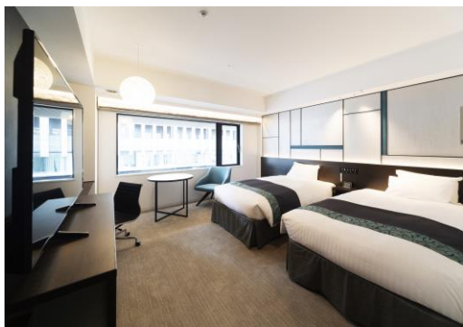
デラックスツイン