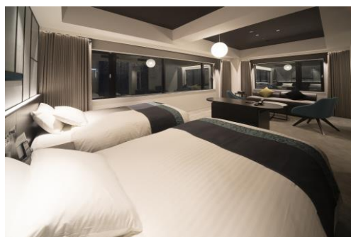
ヴィスキオツイン