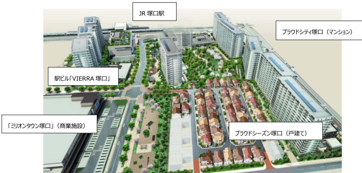
「ZUTTOCITY（総開発面積約 8.4ha）」全体イメージ図

開発地区内には、このたび竣工した分譲マンション「プライドシティ塚口」（1,200戸）ほか多彩な商業施設を集積したJR塚口駅ビル「VIERRA 塚口」、スーパーやクリニックなどで構成される「ミリオントウン塚口」、分譲戸建て「プライドシーズン塚口」（71戸）などの整備が完了し、多機能で高い利便性を有する駅直結の複合再開発となっています。