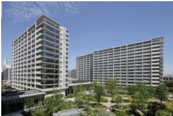
左上：プラウドシティ塚口 外観