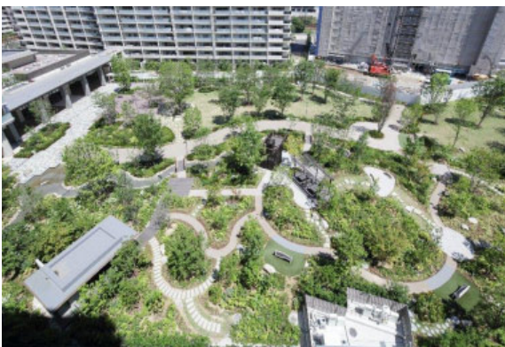
左下：みんなの森 空撮