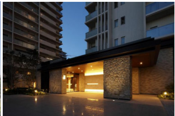
右上：エントランス