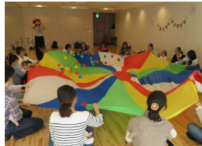
<子育て交流会「手遊び&親子ふれあい遊び」> 0歳～3歳までの親子向け交流。 (2017年秋、「フィットネスルーム」、約160名参加)