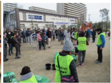
<街づくり協議会主催「クリーンアップ大作戦」> ZUTTOCITY 街区内のクリーンアップ (ごみ拾い) (2017年冬、約160名参加)