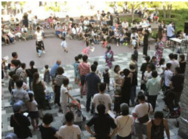
<夏祭り> 住民によるステージや屋台など (2017年夏、「みんなの森」など、約1,100名参加)