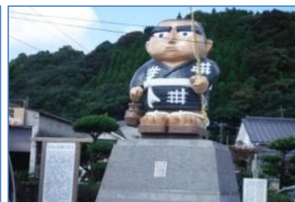
霧島市内（西郷どん像）