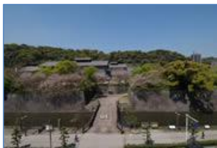
鹿児島市内（鶴丸城跡）

※まち歩きに参加できなかった場合は、鹿児島中央駅インフォメーションにて、西郷隆盛をモチーフにしたグッズと引き換えることができます。