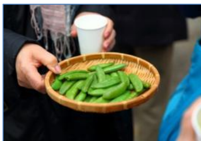
指宿市内（スメ料理）