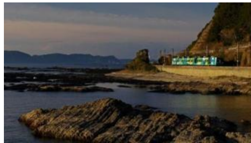
公募したデザインの 105 系列車 (写真は昨年のものです。)